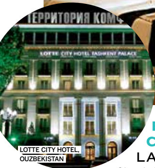
LOTTE CITY HOTEL, OUZBEKISTAN