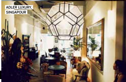
ADLER LUXURY, SINGAPOUR