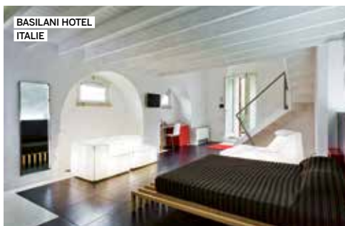
BASILIANI HOTEL ITALIE

➔ Adler Luxury Hostel, 30€ la nuit, adlerhostel.com