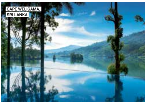
CAPE WELIGAMA, SRI LANKA

➔ Sandibe Okavango Safari Lodge, 700€ la nuit en formule tout compris, les virées en jeep incluses, andbeyond.com