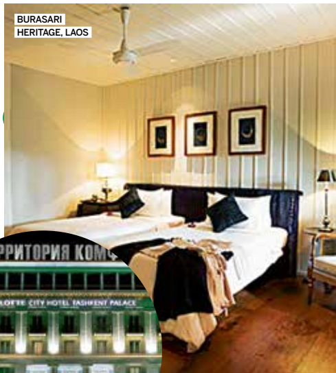
BURASARI HERITAGE, LAOS