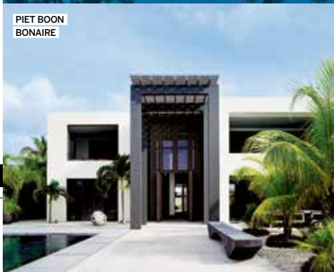
PIET BOON BONAIRE