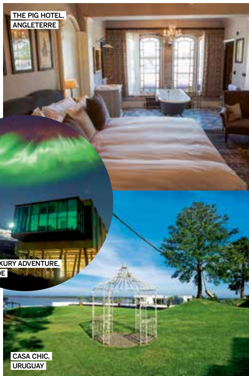
THE PIG HOTEL, ANGLETERRE