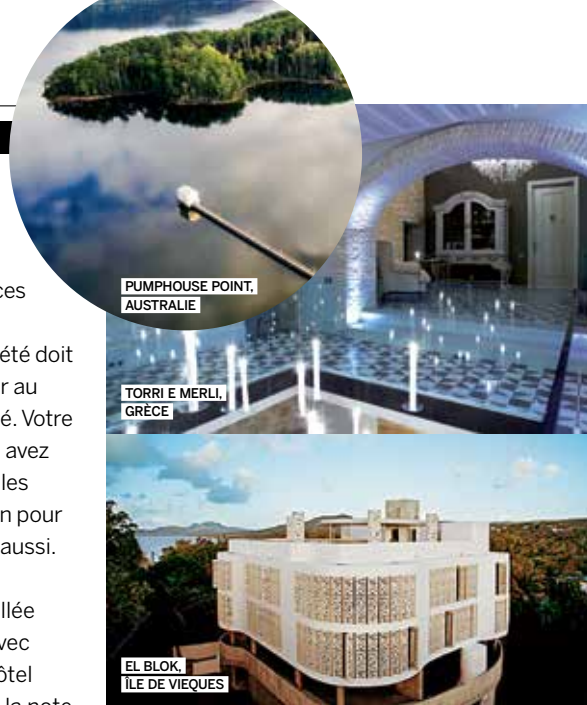
PUMPHOUSE POINT, AUSTRALIE