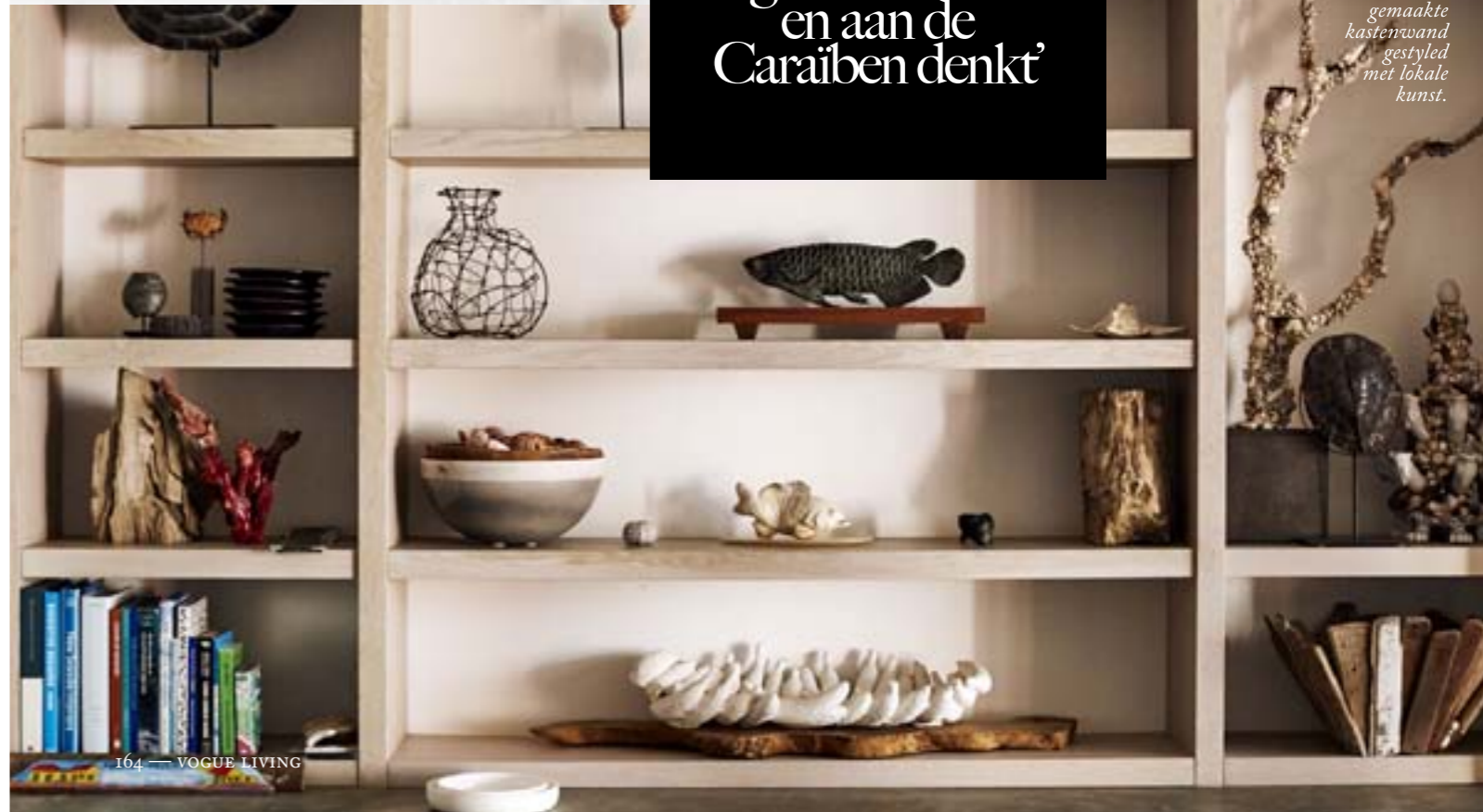
Een op maat gemaakte kastenwand gestyled met lokale kunst.

'Bonaire is voor mij de droom die je ziet als je je ogen dichtdoet en aan de Caraïben denkt'